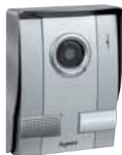
kat.br. 3 692 10: video interfon kit crne boje